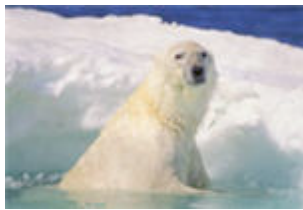
Un ours polaire