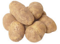
Des pommes de terre